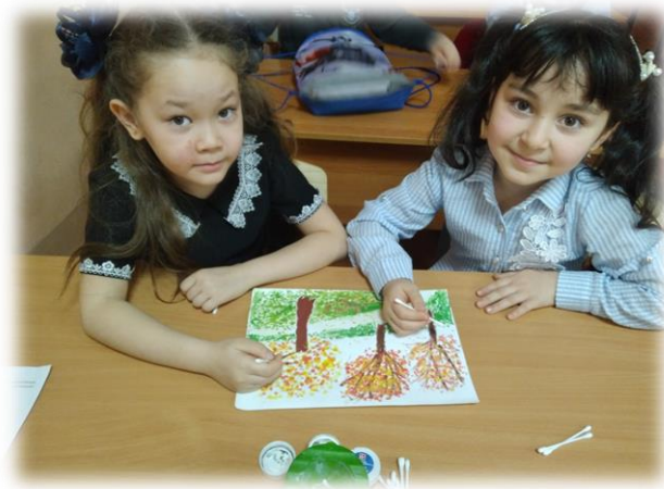
«Рисунок 7. Пуантилизм»

Рисование мыльными пузырями. Опустить трубочку в смесь (гуашь, мыло, вода) и подуть так, что бы получились мыльные пузыри. Чистый лист бумаги прикладывать к пузырям, как бы перенося их на бумагу. Получаются интересные отпечатки, можно дорисовать детали.