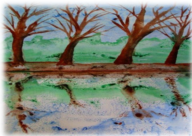
«Рисунок 3. Монотипия»

Кляксография. В основе этой техники рисования лежит обычная клякса. В процессе рисования сначала получают спонтанные изображения. Затем ребенок дорисовывает детали, чтобы придать законченность и сходство с реальным образом. Оказывается, клякса может быть и способом рисования, за который никто не будет ругать, а, наоборот, еще и похвалят.