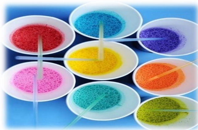
«Рисунок 9. Рисование мыльными пузырями»

Рисование мыльными пузырями. Опустить трубочку в смесь (гуашь, мыло, вода) и подуть так, что бы получились мыльные пузыри. Чистый лист бумаги прикладывать к пузырям, как бы перенося их на бумагу. Получаются интересные отпечатки, можно дорисовать детали.