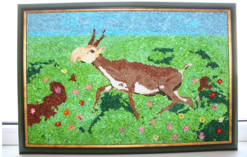
Рисунок 3. «Сайгаки – самые древние обитатели нашей степи в Красной книге»

В направлении экологии тема: «Сайгаки – самые древние обитатели нашей степи в Красной книге» (рис3, 4) приобретает особую актуальность в настоящее время, когда в результате глобальных изменений климата и ослабления сельскохозяйственной (пастбищной) деятельности человека произошло заметное изменение среды обитания животных, которое сказалось на состоянии их популяций.