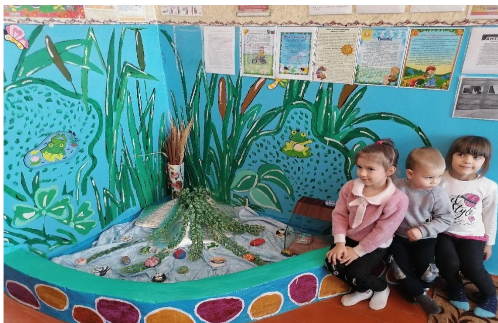
Рисунок 8. Ребята украсили своими камушками уголок в группе