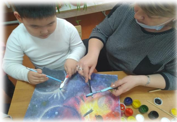
«Рисунок 5. Набрызг»

Ниткография. Способ получения изображения: опускаем нитки в краску, что бы они пропитались, концы нитки при этом должны оставаться сухими. Укладываем нитку на листе бумаги в произвольном порядке, сверху накрываем чистым листом бумаги, концы нитки должны быть видны. Потянуть за концы нитку, одновременно прижимая верхний лист бумаги. После освоения этой техники с использованием одной нитки можно усложнять работу и использовать две и более нити.