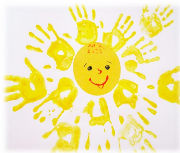
«Рисунок 2. Печать от руки»

Печать от руки. Способ получения изображения: ребёнок опускает в гуашь ладошку (всю кисть) или окрашивает её с помощью кисточки и делает отпечаток на бумаге. Рисуют и правой и левой руками, окрашенными разными цветами.