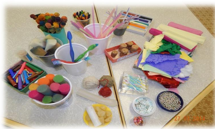
«Рисунок 1. Нетрадиционные инструменты»

Печать от руки. Способ получения изображения: ребёнок опускает в гуашь ладошку (всю кисть) или окрашивает её с помощью кисточки и делает отпечаток на бумаге. Рисуют и правой и левой руками, окрашенными разными цветами.