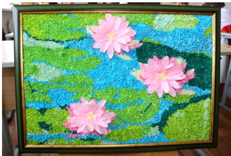
Рисунок 2. «Лотос как символ Калмыкии»

В направлении экологии тема: «Сайгаки – самые древние обитатели нашей степи в Красной книге» (рис3, 4) приобретает особую актуальность в настоящее время, когда в результате глобальных изменений климата и ослабления сельскохозяйственной (пастбищной) деятельности человека произошло заметное изменение среды обитания животных, которое сказалось на состоянии их популяций.