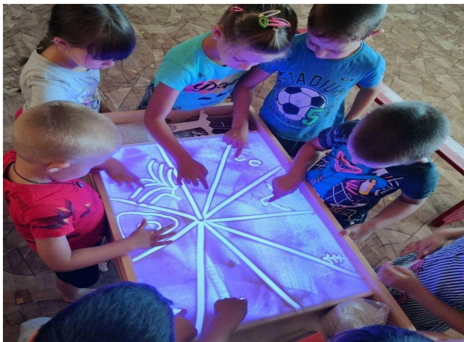
Рисунок 1. Рисование и моделирование песком