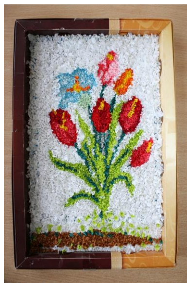
Рисунок 1. «Тюльпан как символ Калмыкии»

В краеведении актуальна тема: «Лотос и тюльпан как символ Калмыкии» (рис.1, 2) тем, что в последнее время участились случаи небрежного отношения к этим прекрасным цветам, тем более неоправданного - ведь они не живут долго вне своей среды обитания, к проблемам выживания растений в природе и сохранению этих растений как культурного наследия малой родины.