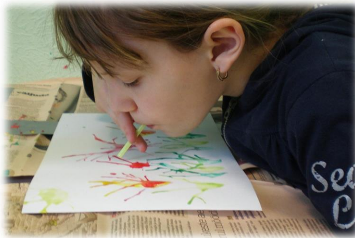
«Рисунок 4. Кляксография»

Кляксография. В основе этой техники рисования лежит обычная клякса. В процессе рисования сначала получают спонтанные изображения. Затем ребенок дорисовывает детали, чтобы придать законченность и сходство с реальным образом. Оказывается, клякса может быть и способом рисования, за который никто не будет ругать, а, наоборот, еще и похвалят.