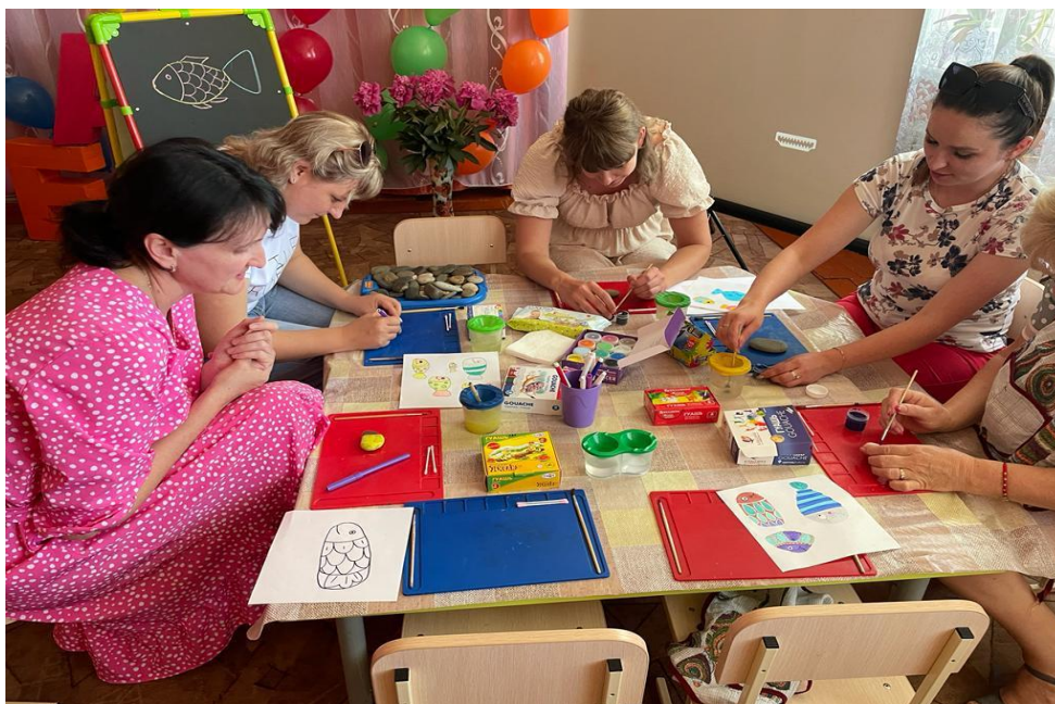
Рисунок 9. Методическое объединение у нас в саду. Мастер-класс для педагогов (каждый рисует свою рыбку)

И еще мы с ребятами попробовали очень интересную технику рисования на крахмале «Неньютоновская жидкость для детей». Все - и воспитатель, и дети получили огромное удовольствие от проделанной работы. Этот метод объединяет в себе рисование и проведение эксперимента. В качестве холста мы использовали формочки с неньютоновской жидкостью, которую сделали педагог совместно с детьми.