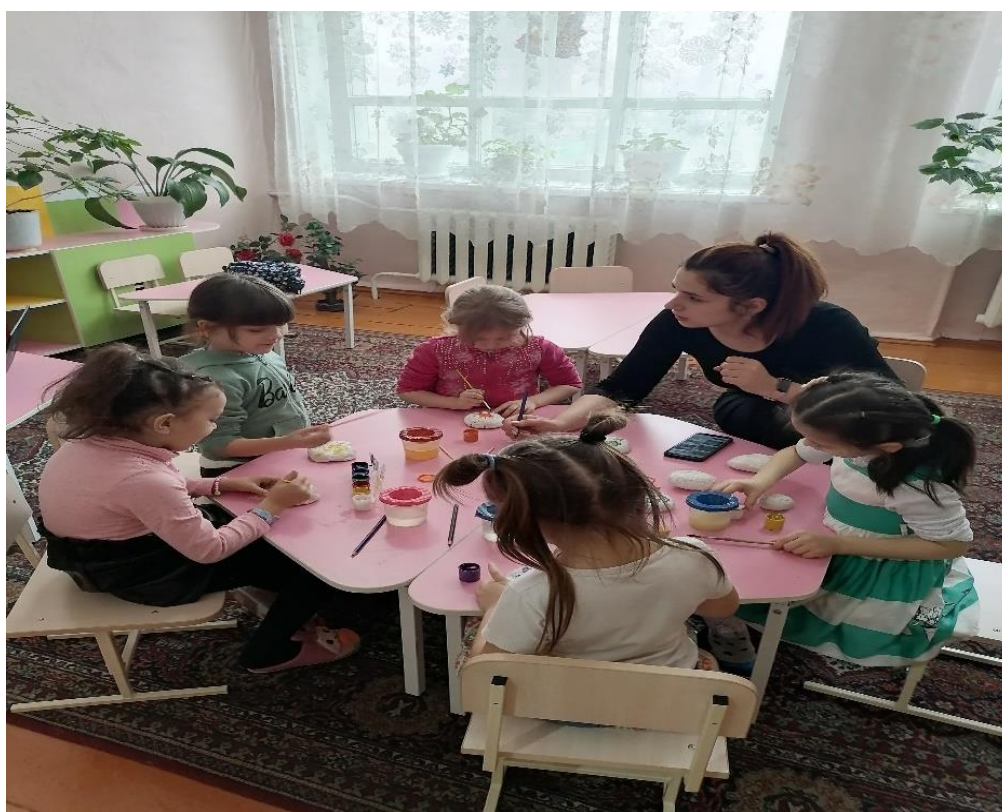
Рисунок 6. Дети с удовольствием рисуют на камушках

Я считаю, что для детей рисование техникой Эбру является прекрасным инструментом развития воображения, моторики, творчества. Красивые узоры, цветы, звезды получаются как бы сами собой, что не может не радовать маленьких художников. А полученные изображения могут выступать как собственный рисунок (т.е. законченной работой) или послужит фоном для дальнейшего творчества. Хочется отметить, что техника Эбру напоминает собой бесконечное медитативное движение, расслабляющее, успокаивающее и снимающее нервное напряжение. Такое занятие не только увлекает, но и прекрасно успокаивает активных и беспокойных детей.