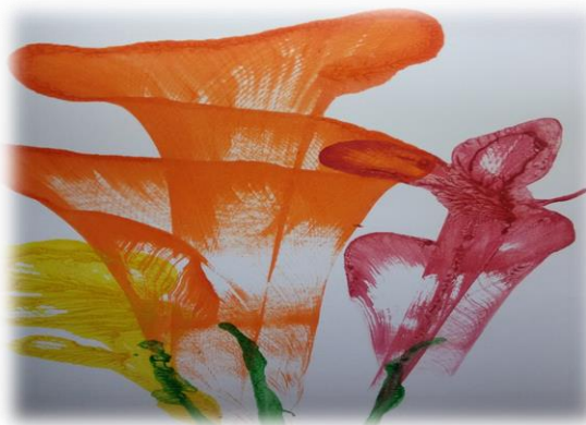
«Рисунок 6. Ниткография»

Ниткография. Способ получения изображения: опускаем нитки в краску, что бы они пропитались, концы нитки при этом должны оставаться сухими. Укладываем нитку на листе бумаги в произвольном порядке, сверху накрываем чистым листом бумаги, концы нитки должны быть видны. Потянуть за концы нитку, одновременно прижимая верхний лист бумаги. После освоения этой техники с использованием одной нитки можно усложнять работу и использовать две и более нити.