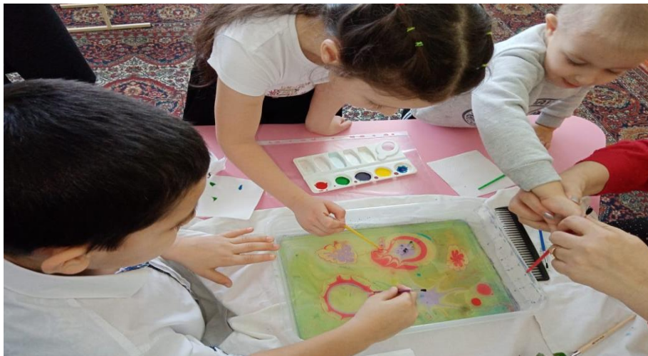
Рисунок 3. Коллективное рисование

Рисование в технике ЭБРУ (рисовании на воде):