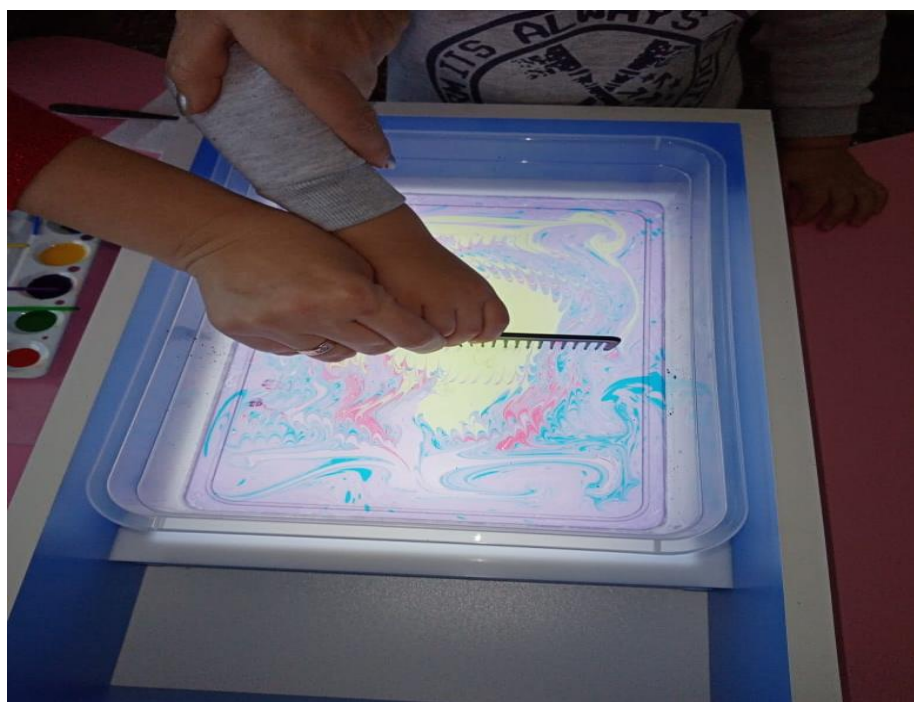
Рисунок 4. Рисуем узоры