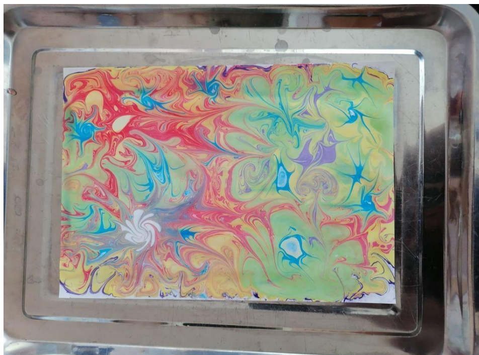
Рисунок 4. Рисунок, перенесенный на бумагу