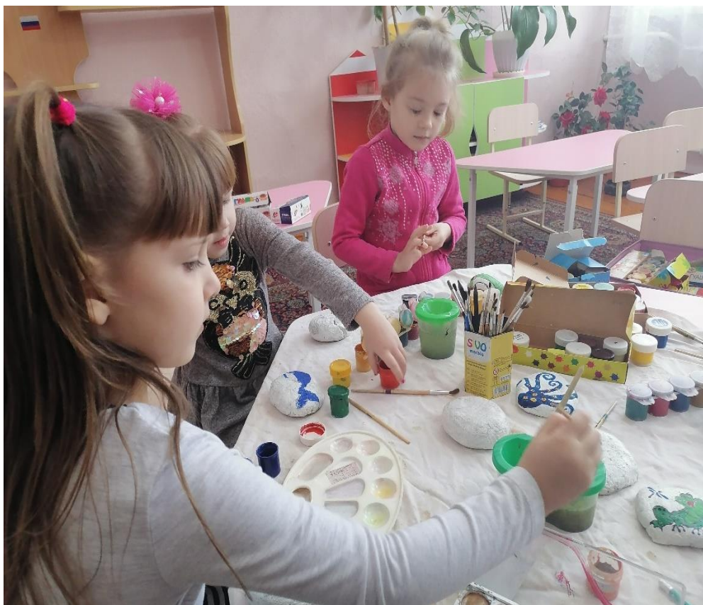
Рисунок 7. Наши девочки рисуют морских обитателей