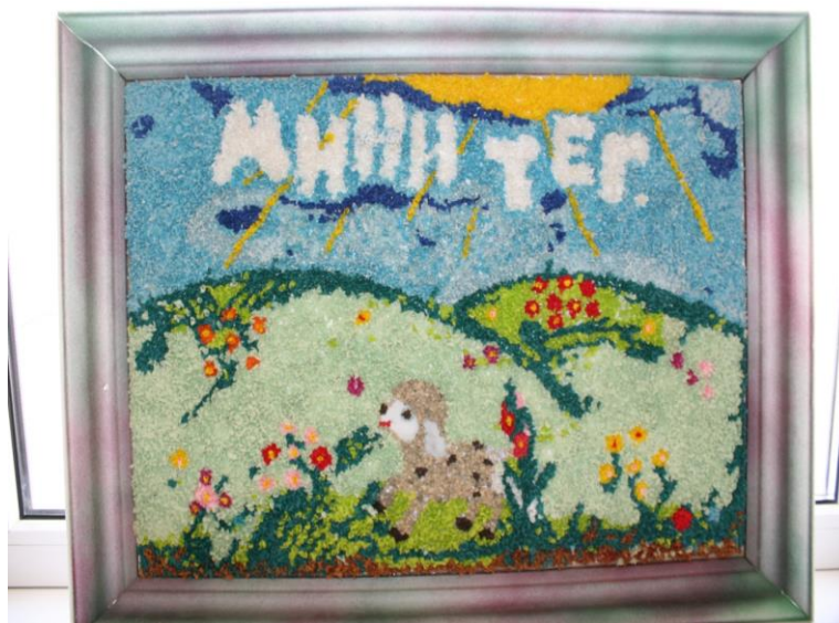
Рисунок 4. «Сайгаки – самые древние обитатели нашей степи в Красной книге»

В настоящее время наблюдается повышенный интерес к изучению родного края. Одной из главных ступеней духовно-нравственного развития ребёнка, определённых в «Концепции духовно-нравственного развития и воспитания личности гражданина России» является «осознанное принятие традиций, ценностей, особых форм культурно-исторической, социальной и духовной жизни его родного города, района, области, страны».