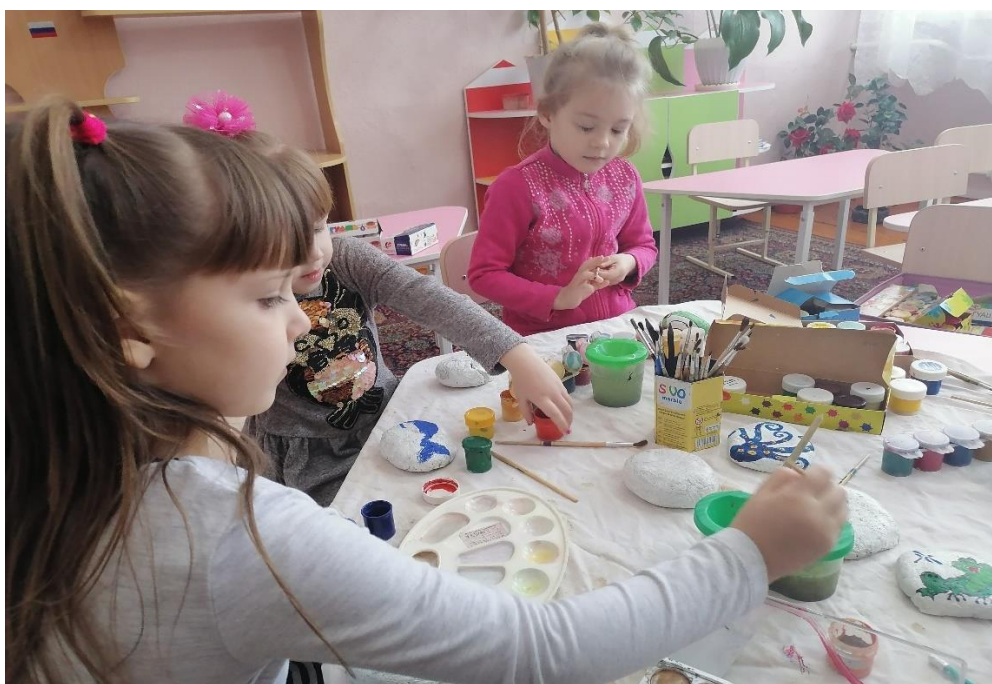
Рисунок 7. Наши девочки рисуют морских обитателей