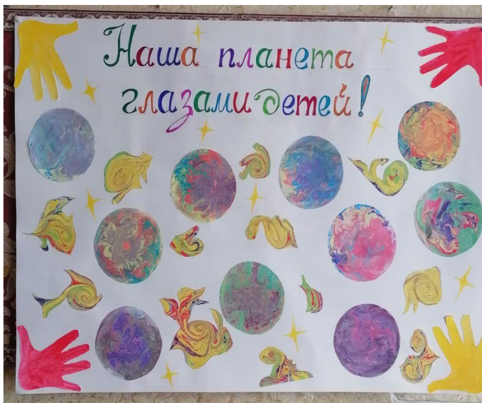
Рисунок 5. Из детских рисунков в технике Эбру сделали совместно с детьми красивый плакат

Я считаю, что для детей рисование техникой Эбру является прекрасным инструментом развития воображения, моторики, творчества. Красивые узоры, цветы, звезды получаются как бы сами собой, что не может радовать