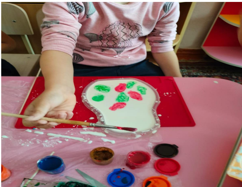
Рисунок 10. Рисунок на крахмале