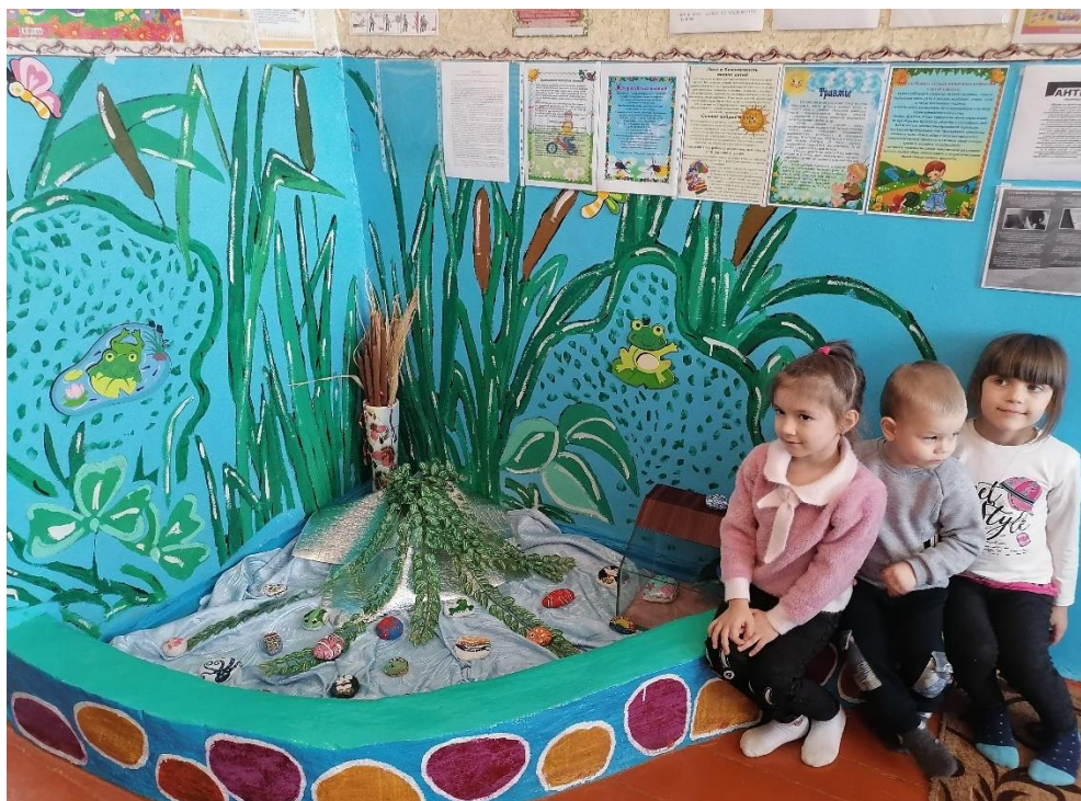
Рисунок 8. Ребята украсили своими камушками уголок в группе