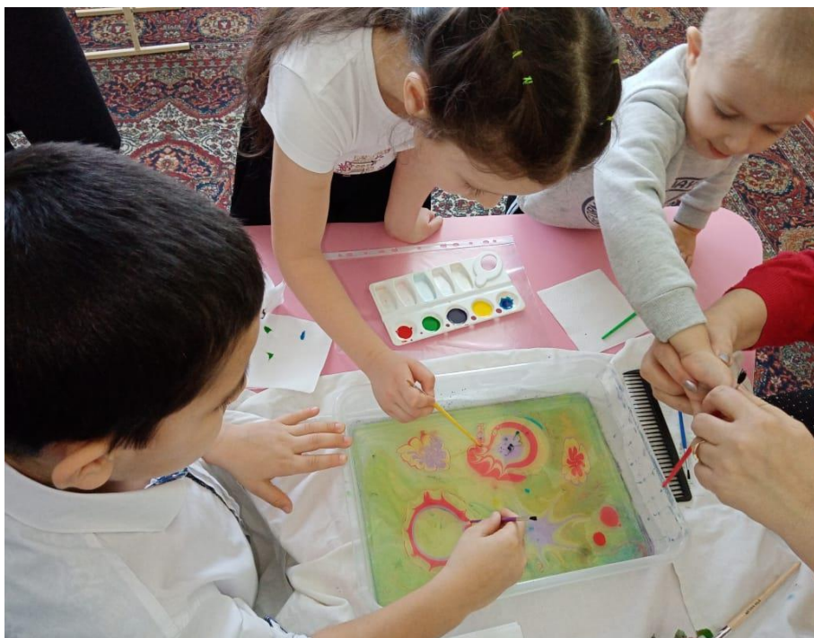
Рисунок 3. Коллективное рисование

Рисование в технике ЭБРУ (рисовании на воде):