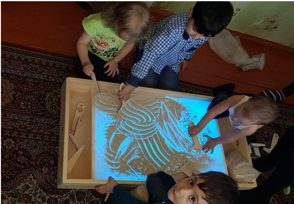
Развивающая предметно-пространственная среда