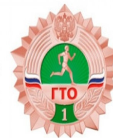
Бронзовый знак отличия