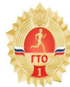
Золотой знак отличия

Сдать ГТО совсем непросто, ты ловким, сильным должен быть, чтоб нормативы победить. Значок в итоге получить. Пройдя же все ступени вверх, ты будешь верить в свой успех. И олимпийцем можешь стать, медали точно получить. Вперед к победам, дошколянок!