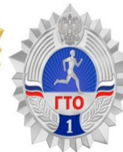
Серебряный знак отличия